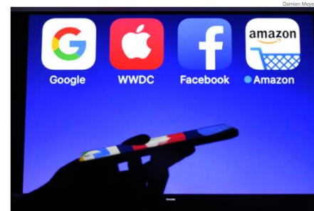
Projeção da tela de exibição de um smartphone