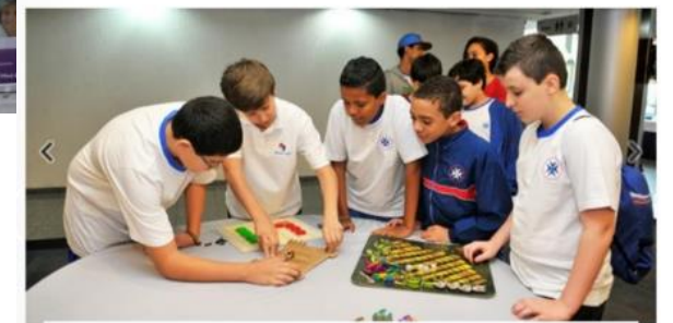
Especialistas apontam os rumos que a Base Nacional Comum Curricular deve seguir nos próximos meses